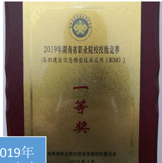
2019年 BIM省赛 一等奖