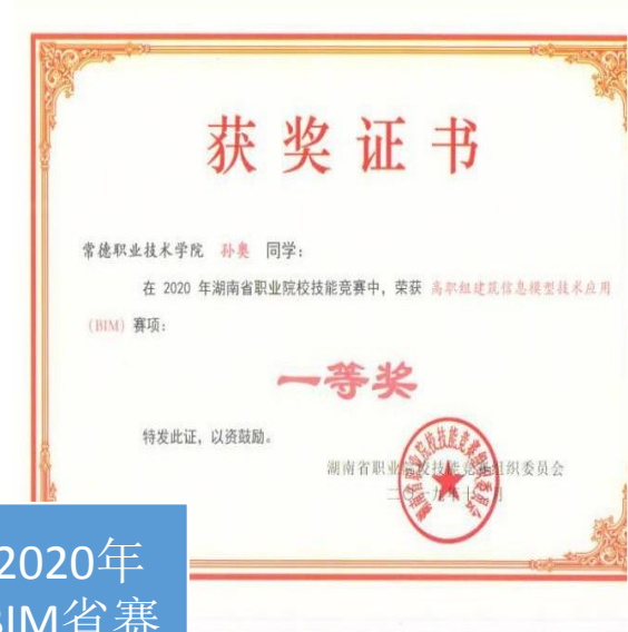
2020年 BIM省赛 一等奖